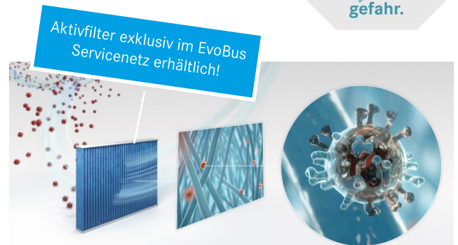
Minimierung der Schadstoffe durch effiziente Feinfiltration der Frisch- und Umluft